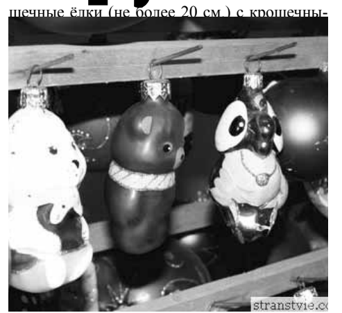
шечные ёлки (не более 20 см) с крошечными игрушками. И так, до наших дней. Вдруг открывается дверь – кто это? Это Дед Мороз и Снегурочка пришли поздравить ребятнишек с наступающим праздником. Дети рассказали Дедушке стихи, отгадали все его загадки и получили подарки. Дедушка предупредил, что подарки будут и в автобусе, какие – увидим. Потом повели хором и от всей души попрощались.

Музей был шикарный. Вдоль стен стояли красавицы-ёлки. Каждая из них наряжена в соответствии со своим периодом. Например, до войны ёлки наряжали картонными блестящими фигурками. В 50-е годы игрушки делали на прищепках (я помню такие). Когда первый человек полетел в космос, стали выпускать космонавтов. А когда советские люди жили в коммуналках, стали выпускать кро-